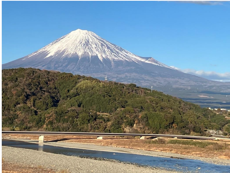
静岡分苑近郊から（2024年1月1日撮影）

たてよりの機 はた のしぐみは神 かむ ながら 打 う たれたたか にしきお れ錦織るなり 出口 でぐち すみ子