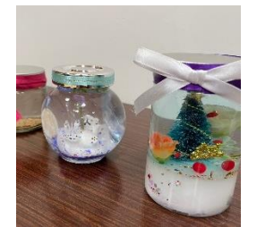
12月のお楽しみ会で作成されたスノードームです♪